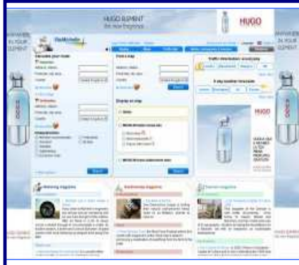
Road Block Habillage de page + exclu rectangle (avec ou sans vidéo).