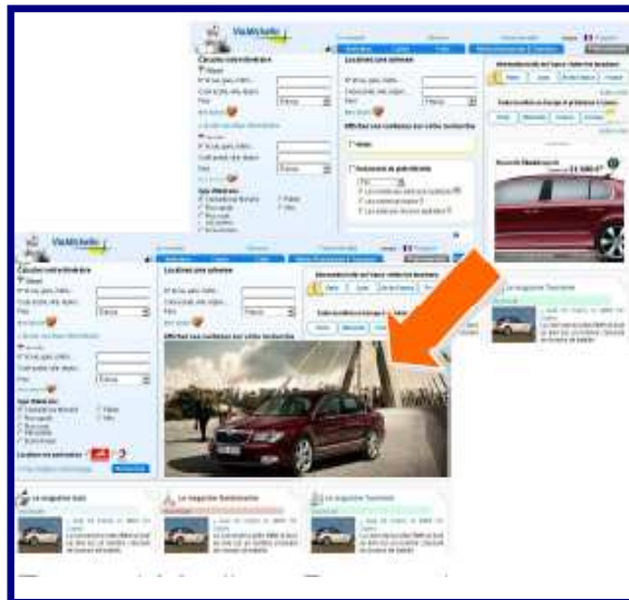
Rectangle Expand Premium Le format 300x250 se déploie en 658x305 et recouvre la recherche d'hôtels et Guides Michelin