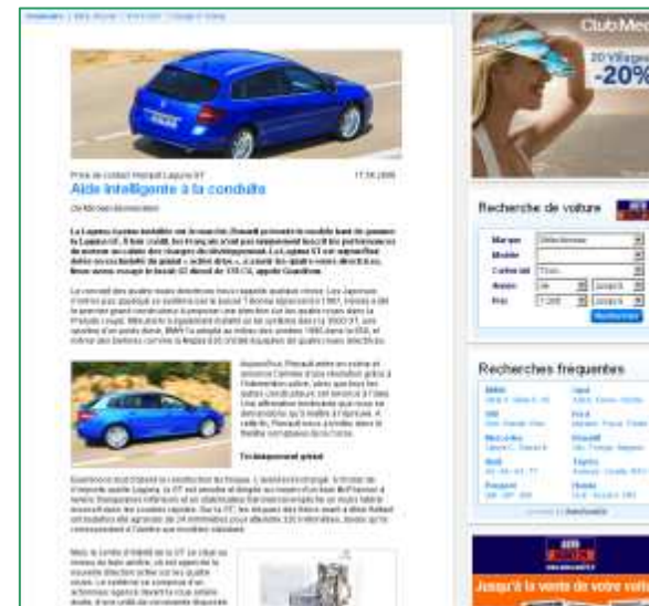
Exemple Publi rédactionnel AUTO