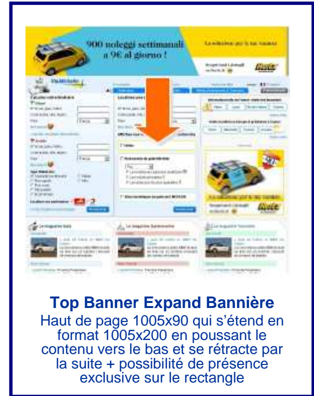
Top Banner Expand Bannière Haut de page 1005x90 qui s'étend en format 1005x200 en poussant le contenu vers le bas et se rétracte par la suite + possibilité de présence exclusive sur le rectangle